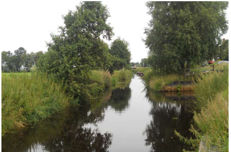
Im „Drei-Länder-Eck“ von Karlshöfenmoor, Kuhstedtermoor und Findorf soll der neue Moorhafen entstehen.

Durch die mögliche Koppelung mit bisherigen Angeboten (Radwandern, Kahnfahrten, Moorexpress, Gastronomische Angebote) und Einrichtun-