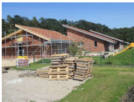
Für die Kinderkrippe wird ein dritter Gruppenraum gebaut.

Angefangen bei den Kleinsten: vor zwei Jahren haben wir die neue Krippe eröffnet, an die bereits der dritte Gruppenraum angebaut wird. Zum ersten Mal haben wir den Schritt gewagt, eine Einrichtung in „fremde“ Trägerschaft zu geben und mit dem SOS-Kinderdorf einen Glücksgriff getan. Die Resonanz auf die Krippe ist durchweg positiv, die in den Richtlinien recht knapp bemessene Personalausstattung wurde von SOS aufgestockt. Uns wichtige Anliegen, wie Elternarbeit, offene Angebote für Eltern und Kinder u.v.m. werden engagiert realisiert, Kinder und Eltern fühlen sich wohl.