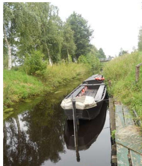
Durch den Moorhafen sollen noch mehr Touristen nach Gnarrenburg kommen.

Die SPD-Gnarrenburg und die Kandidaten 2011 unterstützen die ILEK-Vorhaben und stehen voll hinter diesen Projekten.