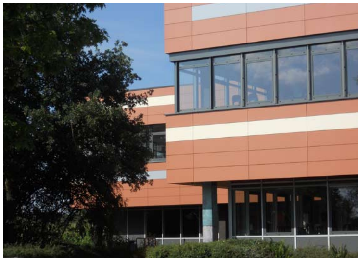
Die Sanierung der Oste-Hamme-Schule ist fast fertig.

Nicht zuletzt startet dank des gemeinsamen Engagements von Schule, Eltern, Politik und Verwaltung in wenigen Wochen die Oberschule mit gymnasialem Zweig in